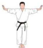
Kaiun no te